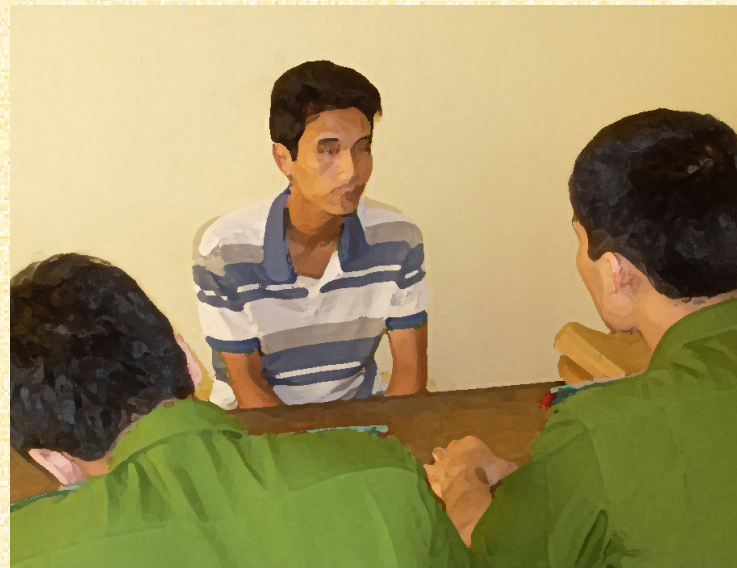
Lấy lời khai của đối tượng phạm tội chưa đạt

Theo Điều 15 Bộ luật hình sự 2015, phạm tội chưa đạt là